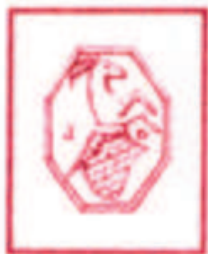
Pro Loco Onanese

Tra le priorità individuate, l'organizzazione delle imminenti festività Natalizie: il presepe vivente nel centro storico, il concerto della banda musicale S. Cecilia e la