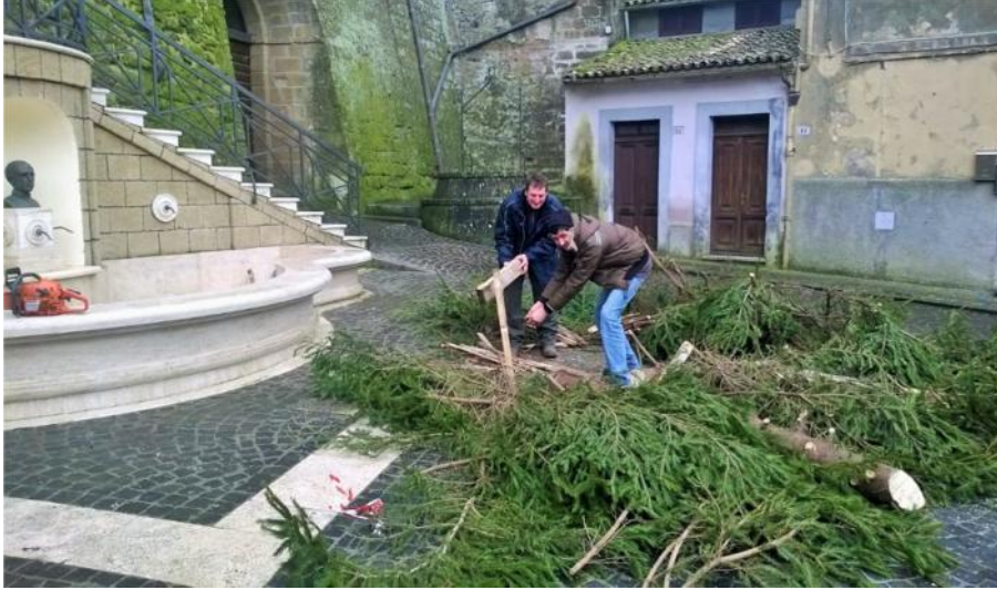
S'ammuntinono le legna