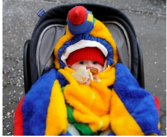
Ginevra: la ticchia più piccina