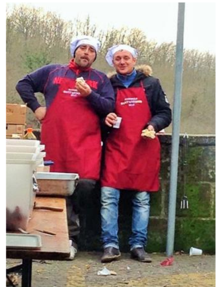
Le festarole co' le sinale e le cappelle da coche