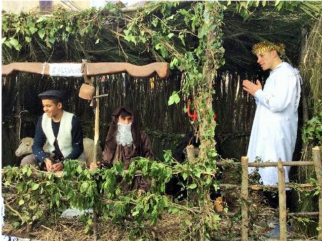
Scappono le carre