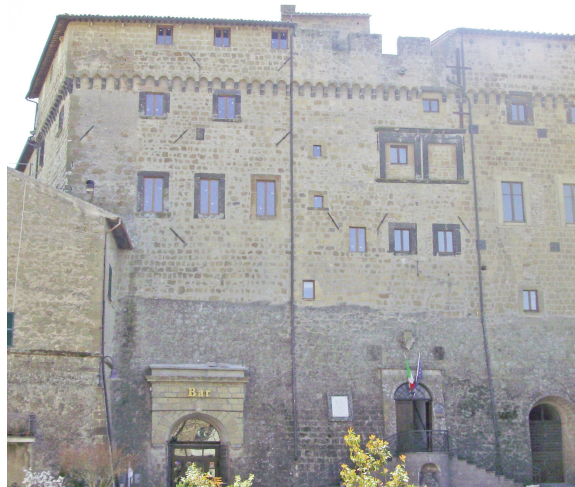
La facciata di Palazzo Monaldeschi completata con i nuovi infissi ritorna all'antico splendore

Certo con il senno del poi le cose si possono affrontare e risolvere in