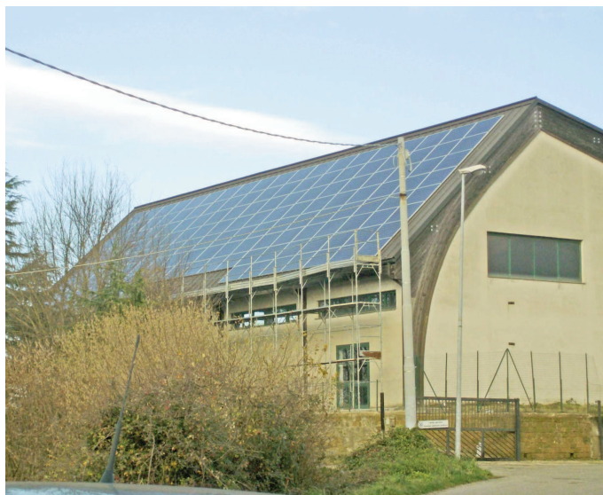
Pannelli fotovoltaici installati sul tetto della palestra comunale

te per sbloccare progetti presentati anche dalla passata Amministrazione, purché il nostro piccolo paese possa rivitalizzarsi. Forse siamo in dirittura d'arrivo per lo sblocco dei finanziamenti che riguardano la riqualificazione delle facciate e per altri progetti che risalgono addirittura agli inizi del 2000. In merito, cosa di poco conto, informiamo che nel 2011 il Vigile Urbano avrà a disposizione una nuova autovettura.