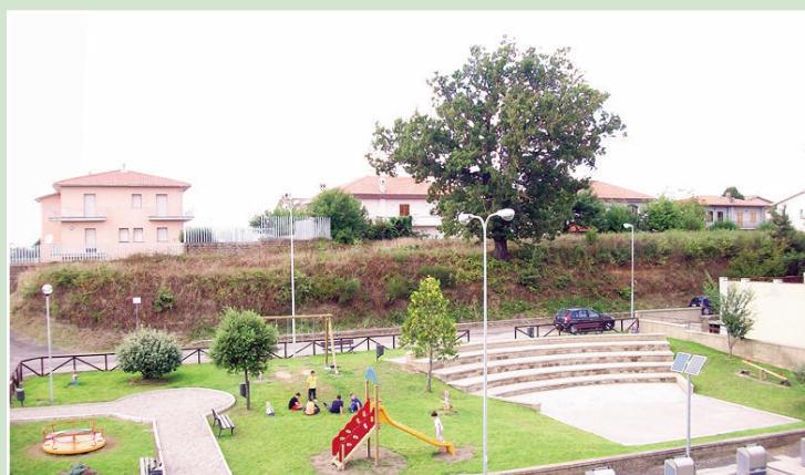
Il Giardino di via G. Sarti realizzato nel corso del 2013